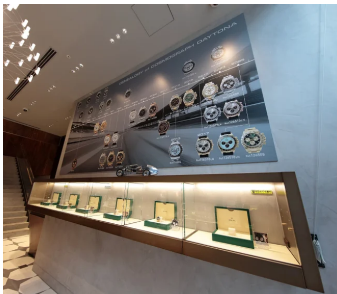
デイトナ年表と商品展示例